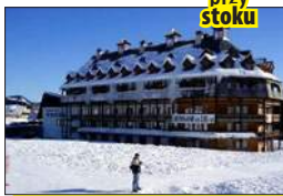
Hotel przy stoku